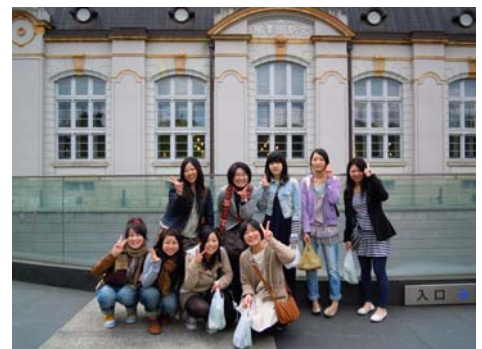
京都府立図書館前にて

学生図書委員会では、4/24(土)に第1回親睦会を実施しました！ 八坂神社、知恩院、平安神宮など身近の京都を観光し、 参加者一同、友好を深めることができました。 好評につきまして、来月には第2回親睦会を実施します！